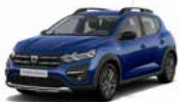
BLÅ "IRON" (MEL)

ML: Mat lak (standard) MEL: Metallak (ekstraudstyr)