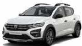
HVID "GLACIER" (ML)