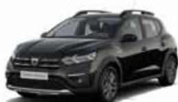
SORT "NACRE" (MEL)