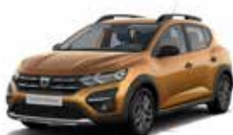
ORANGE "ATACAMA" (MEL)