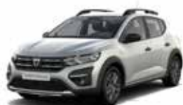
GRÅ "HIGHLAND" (MEL)