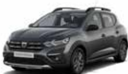
GRÅ "COMETE" (MEL)