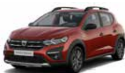
RØD "FUSION" (MEL)