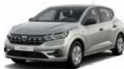
RØD "MOONSTONE" (MEL)