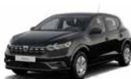
SORT "NACRE" (MEL)