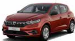
RØD "FUSION" (MEL)