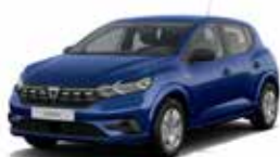
BLÅ "IRON" (MEL)

ML: Mat lak (standard) MEL: Metallak (ekstraudstyr)