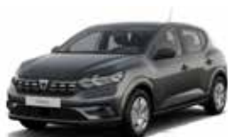
GRÅ "COMETE" (MEL)