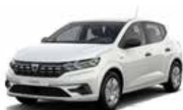
HVID "GLACIER" (ML)