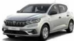
GRÅ "HIGHLAND" (MEL)